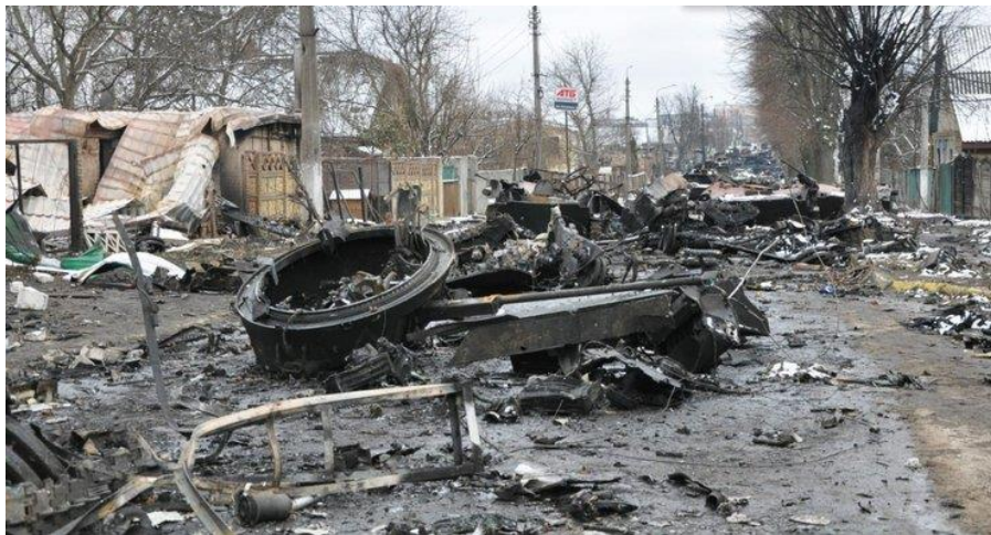
Знищена вогнем української артилерії ворожа бронетехніка. Буча, березень 2022 р.

Світлини з розбитою технікою на початку березня 2022 р. зробили вул. Вокзальну в м. Бучі відомою в усьому світі. Колона була спалена найпотужнішими артилерійськими системами української армії – 203 мм «Піонами» під керівництвом артилеристів 43-ї оабр, які продемонстрували високий рівень підготовки завдяки постійним злагодженням та ротачії на Донбас. Напередодні повномасштабного вторгнення дивізіон мав убувати на схід України, проте у лютому підрозділ швидко прибув маршем і зайняв позиції неподалік від Троєщини та Оболоні, а вже з 25 лютого розпочалася робота по російських військах: ворожій техніці та командних пунктах. Протягом місяця оборони Києва «Піонами» вдалося знищити близько 2500 одиниць ворожої техніки. Корегування вогню іноді відбувалося через «Байрактари», а здебільшого за допомогою спостерігачів на місцях (розвідників або небайдужих громадян телефоном). Витрати боєкомплекту на один «Пион» у день могли сягати понад 60 снарядів.