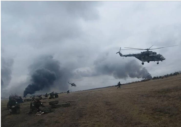
Висадка російського десанту в Гостомелі з гелікоптерів Мі-8

Анонімний боєць ССО, який брав участь в тих подіях, згадував: «Була інформація, що мав прилетіти Іл, який буде висаджувати десант. І наше завдання полягало в тому, що ми не мали дати сісти літаку. Або якщо він сяде, то прийняти контакт і по максимуму подавити противника, вигравши час для інших підрозділів». Крім стрілецької зброї, підрозділ ССО мав і ПЗРК «Ігла» з кількома ракетами. ПЗРК «Ігла» були також в нацгвардійців. Останні мали і кілька зенітних установок ЗУ-23.