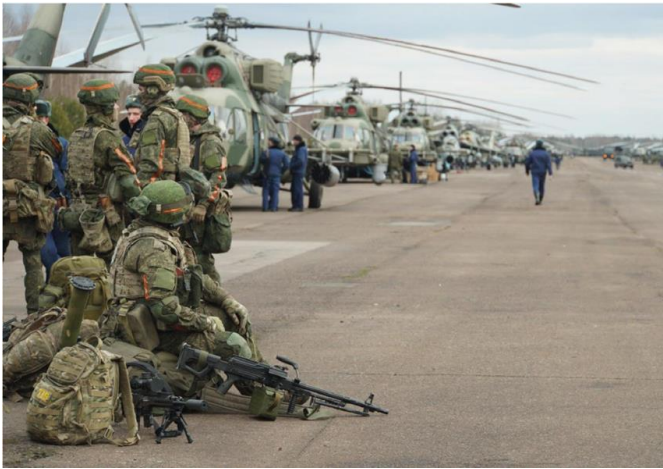
Російські десантники і гелікоптери на одному з білоруських аеродромів

З огляду на важливість завдання з оволодіння аеродромом Гостомель, російське командування виділило для цього «еліту еліт» – 45-ту окрему гвардійську бригаду спеціального призначення Повітряно-десантних військ. Ця частина, дислокована у Кубінці під Москвою, спеціально підготовлена для рейдових дій, а її бійці вирізняються винятковою індивідуальною майстерністю – принаймні, так стверджувала російська пропаганда. Поява підрозділів 45-ї бригади на території Білорусі була помічена вже в останній тиждень січня 2022 року. Кількома днями пізніше в Білорусі з'явилися підрозділи, які мали скласти другий ешелон десанту – 137-й повітряно-десантний полк (місце постійної дислокації – Рязань) тульської 106-ї повітряно-десантної дивізії та батальйон 31-ї окремої десантно-штурмової бригади з Ульяновська.