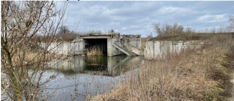
Міст через р. Ірпінь в Мощуні, фотографія квітня 2022 року

Скориставшись мостом в Мощуні, невелика група російських спецпризначенців і рота десантників зі складу 104-го гвардійського десантно-штурмового полку увійшла до населеного пункту намагаючись окопатись на його лісистих околицях. Проте прицільний вогонь української артилерії змусив їх швидко відступити на лівий берег Ірпеня. В село увійшла неповна рота (80 бійців) 72-ї омбр, які знищили міст і закріпились в населеному пункті.