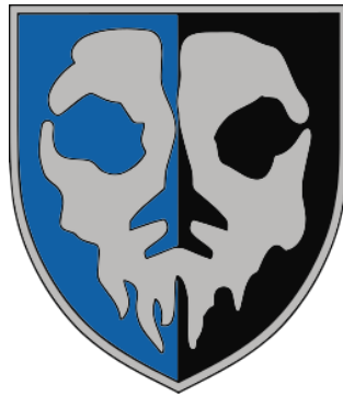
Емблема 40-ї брта, якій за участь в обороні Києва присвоєно почесне найменування «Привид Києва»

темپ протиповітряної боротьби, за якого російські льотчики, попри перевагу в кількості авіаційних груп, почали уникати входження в зону досяжності українських ЗРК, що фактично забезпечило встановлення зони протиповітряного обмеження доступу (A2/AD) над Київським операційним районом. Ефективність взаємодії була посилена залученням підрозділів Територіальної оборони Сил ТрО ЗСУ, зокрема 112-ї окремої бригади ТрО (Київська область), та курсантських підрозділів військових вищих навчальних закладів, які забезпечували безпосередню наземну охорону позицій ППО. Застосування безпілотних авіаційних комплексів у єдиній системі з штурмовою авіацією забезпечило порушення системи матеріально-технічного забезпечення дій противника та створило умови для його поетапного вогневого ураження на маршрутах висування.