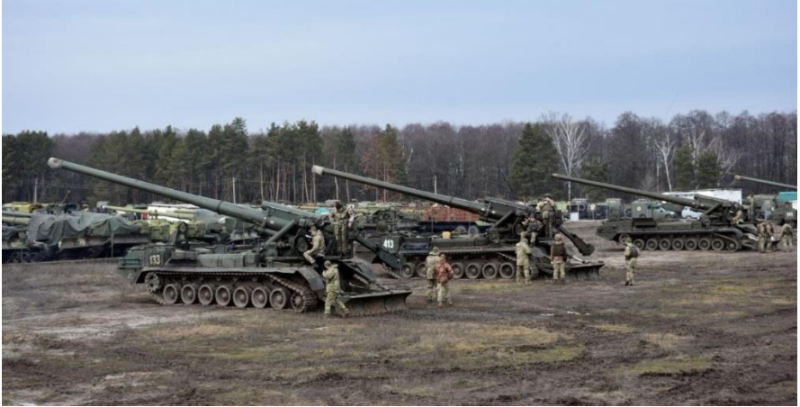
САУ 2С7 «Піон» 43-ї оабр під час навчань 20-21 лютого 2022 р.

Артилерія, завдаючи ударів по позиціях противника та вражаючи десантні підрозділи, знищувала ворожу техніку та завадила російським військам створити в Гостомелі плацдарм для перекидання десанту. Однак у захисників аеродрому закінчувались боєприпаси й вони здійснили відхід, станом на 19.00 контроль над аеродромом було втрачено. Тоді українська артилерія спільно з авіацією нанесли вогневий удар по злітній смузі аеродрому, у результаті чого противник не зміг закріпитися на ньому.