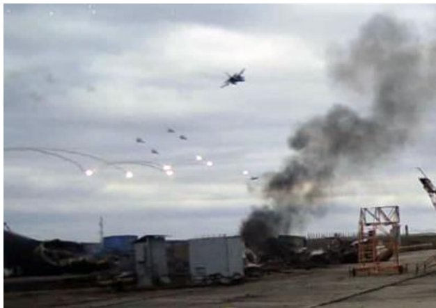
Бомбардувальник Су-24М 7-ї брта завдає бомбового удару по позиціях російських десантників на аеродрмі Гостомель

операційній зоні ворог намагався прорватися через пункти пропуску «Деревини», «Грем'яч» та «Добрянка», розраховуючи на швидкий марш у похідних колонах. Повітряні Сили Збройних Сил України у тісній взаємодії з артилерійськими та механізованими підрозділами, зокрема 72-ю окремою механізованою бригадою імені Чорних Запорозжців та 101-ю окремою бригадою охорони Генерального штабу, організували інтегровану систему багаторівневого вогневого ураження. Значну роль у Київській оборонній операції відіграла 43-тя окрема артилерійська бригада. 24 лютого 2022 р. її підрозділи своїм ходом здійснили марш на відстань 120-140 км, висунувши важкі самохідні гармати 2С7 «Піон» на визначені позиції для вогневої підтримки оборони столиці. Використання вертольотів Мі-8/Мі-24 та БПЛА для авіаційної розвідки й коригування вогню артилерії по колонах противника в районах Броварів та Ірпеня забезпечило зупинку просування батальйонно-тактичних груп (БТГр) сил вторгнення на віддалених зовнішніх рубежах оборони Київського напрямку.