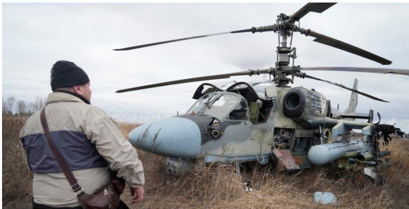
Підбитий Ка-52, що здійснив вимушену посадку

велика група гелікоптерів, яка йшла на малій висоті. Вона нараховувала 16 ударних Ка-52 і 18 Мі-8АМТШ. Останні везли близько 200 десантників зі стрілецькою зброєю, а також протитанковими ракетними комплексами «Корнет» і 82-мм мінометами. Відбулось це, за деякими даними, близько 8 ранку. Однак ця інформація входить в суперечність з повідомленням прес-секретаря 4-ї бригади Харитіна Старського про те, що бій за аеропорт Гостомель почався близько 11:00-11:30. Це перегукється і з повідомленнями працівників аеропорту про те, що атака російських гелікоптерів почалась близько полудня. Відстань від кордону з Білоруссю до Гостомеля не перевищує 150 км. Якби гелікоптери перетнули кордон о 8 ранку, то до аеропорту вони дісталися б не пізніше 9:30. Тобто, очевидно, група, яка висаджувала десант в Гостомелі, перетнула кордон пізніше.